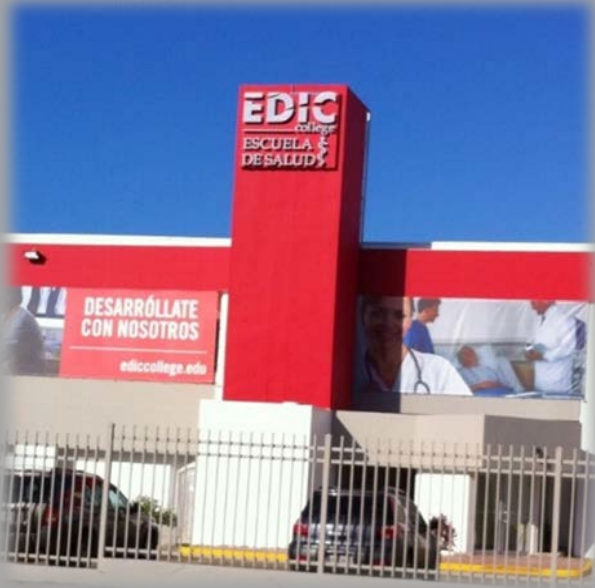
EDIC College Recinto de Carolina