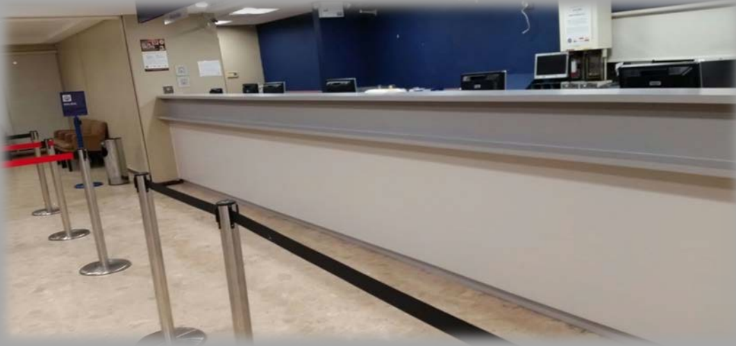
BPPR Sucursal Lomas Verdes