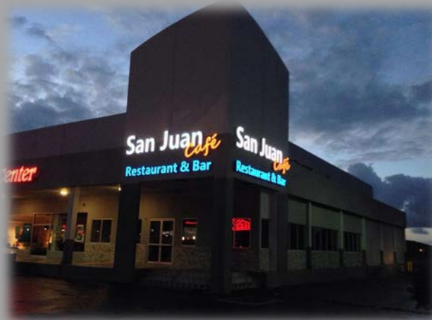
San Juan Café Bar & Grill